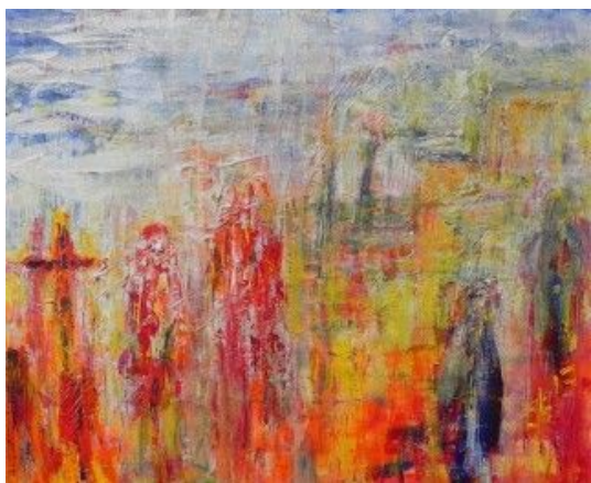
Schilderij "Later" van Irka Stachiw

Sinds enige tijd wordt er binnen het bestuur van Wederzijds gewerkt aan een opzet voor een eigen wilsverklaring. Het doel is om te komen tot een document dat op de website staat en dat geïnteresseerden kunnen downloaden om het te gebruiken.