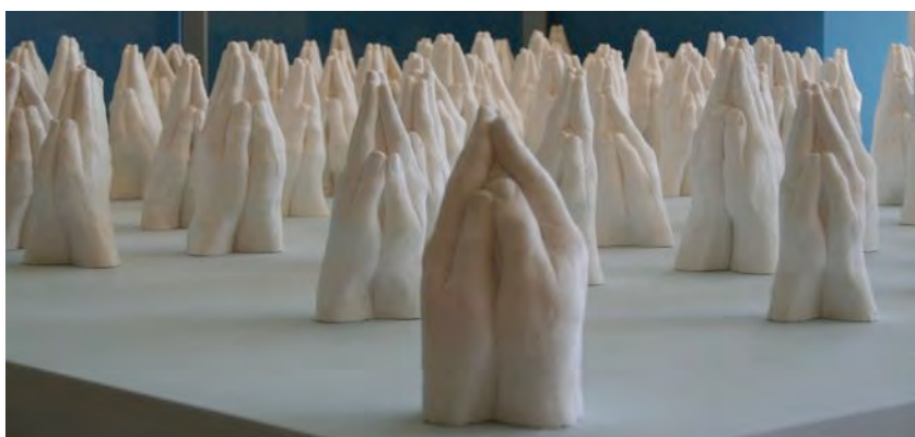
"Het gebed" - Andreas Hetfeld