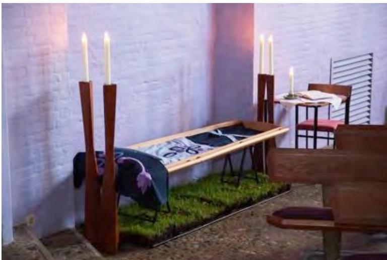
Opbaring met graszoden in de Michaelkerk in Rotterdam