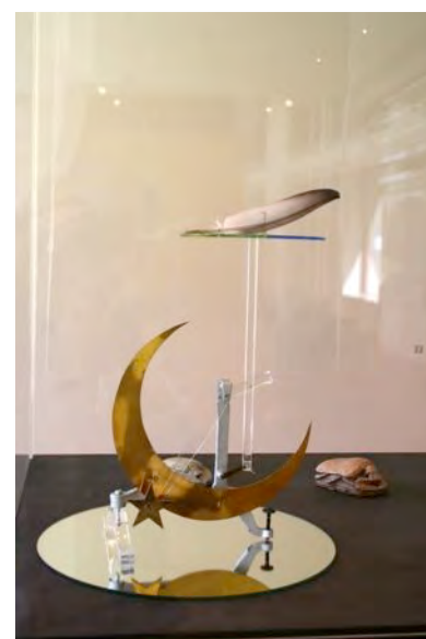
"Zieleweger" - George Belzer

Arboretumlaan 4, 6703 BD Wageningen Openingstijden donderdag t/m zondag van 11:00 - 17:00 uur